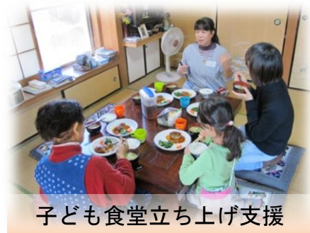
子ども食堂立ち上げ支援