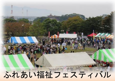
ふれあい福祉フェスティバル