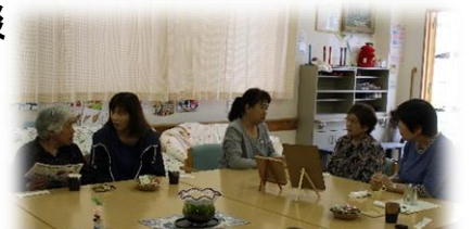
こすもすカフェ（認知症カフェ）