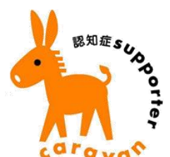
認知症サポーター養成講座