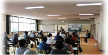
町民向け成年後見講座