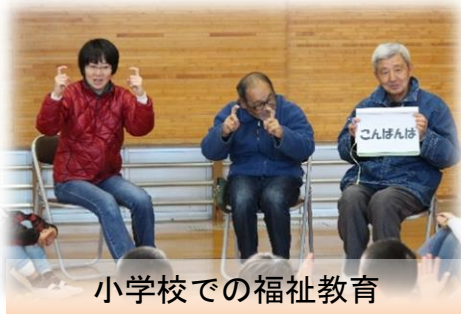
小学校での福祉教育