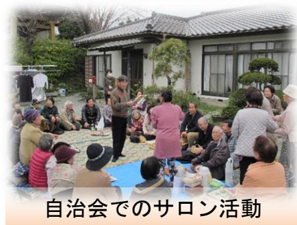
自治会でのサロン活動