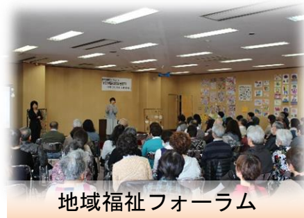
地域福祉フォーラム